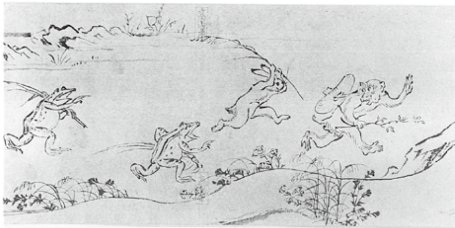
图3『鳥獸人物戯画』甲卷