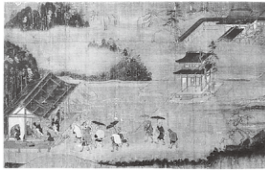
图2『一遍聖絵』第五卷