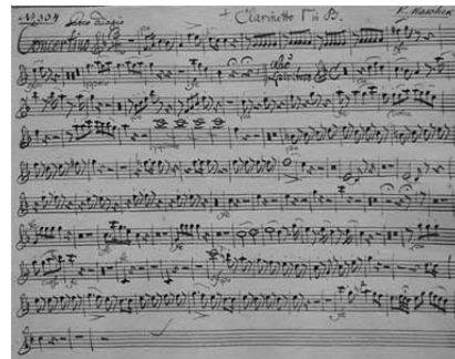
V. マシエク 2台のピアノのための協奏曲 Es-Dur VM III: 6 (CZ-Pnm: XXXVIII C 281) パート譜