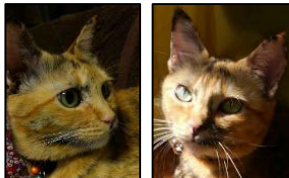
くらいときとあかるいとき