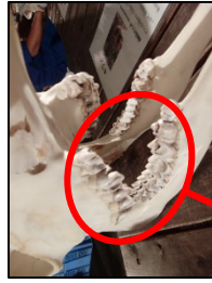
キリンやウシのは